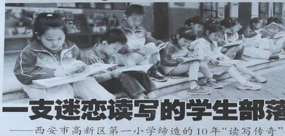
一支迷恋读写的学生部落——西安市高新区第一小学缔造的10年“读写传奇”