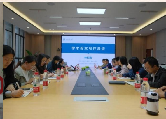
学术论文写作漫谈