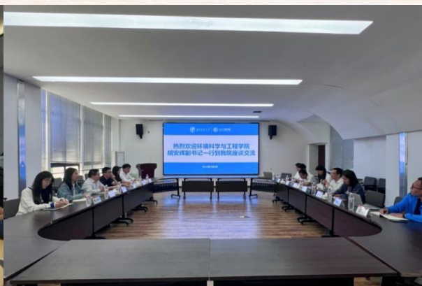
环境科学与工程学院交流