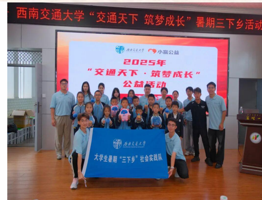
交通天下队伍出征