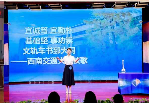
全国科普讲解大赛