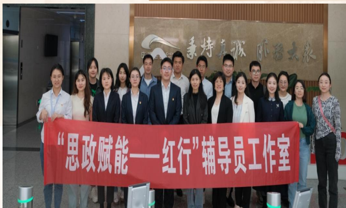
成都地铁运营有限公司