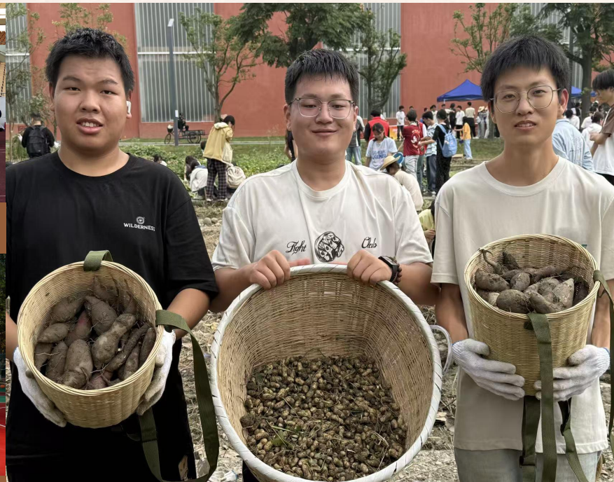
“奋斗正青春”劳动文化节