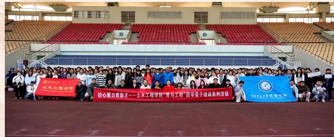
“红土飞young”趣味运动会