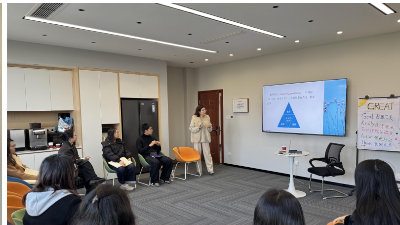
05 教练工具及其运用