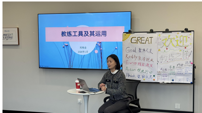
04 教练工具及其运用